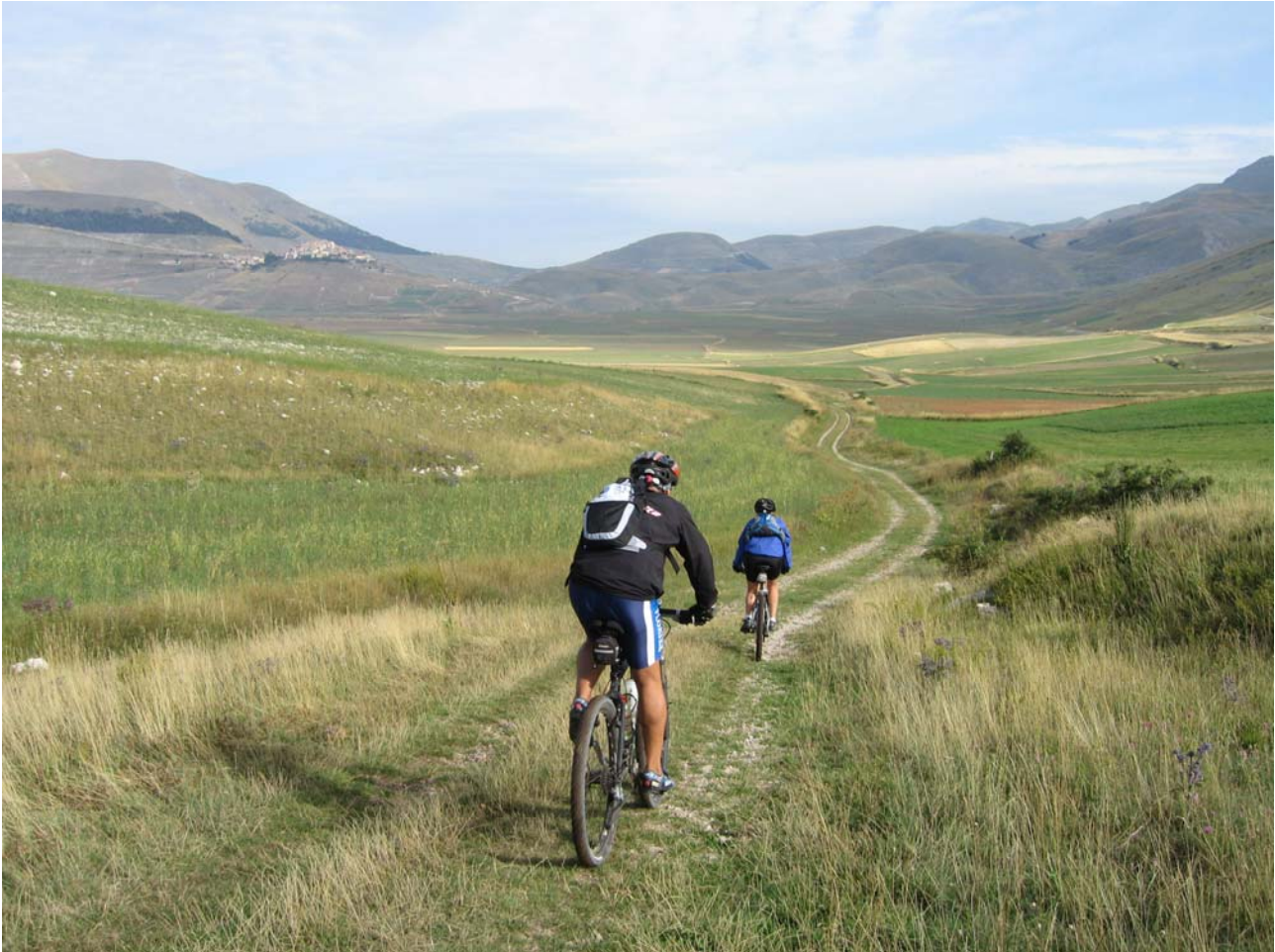
Figura 1 - La Piana con Castelluccio di Norcia sullo sfondo

Per ulteriori informazioni e per effettuare prenotazioni potete rivolgervi presso la sede del CAI ogni mercoledì e venerdì dalle ore 19 alle 20, telefonare allo stesso orario allo 0736 45158 oppure consultare il ns. sito www.caiascoli.it