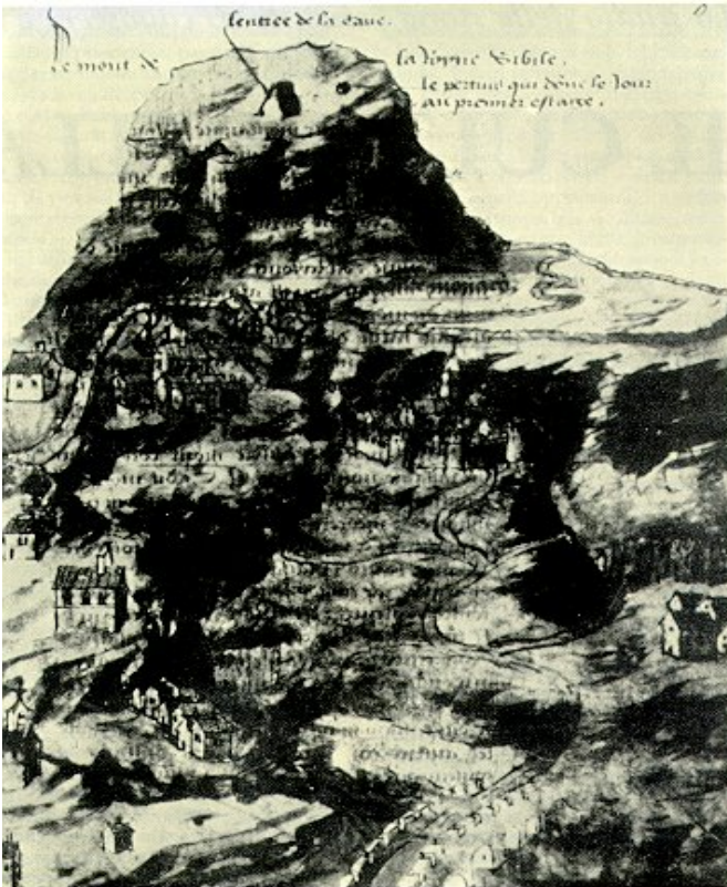
Il Monte della Regina Sibilla disegnato da Antoine de La Sale

Si proseguiva fino ad uno stretto viottolo che conduceva ad una piazza.