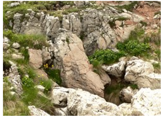
La grotta della Sibilla oggi

Su di un lato della piazza c'erano due porte in metallo che sbattevano ininterrottamente e minacciose". Proseguirono solo i viandanti tedeschi e non si capisce quale destino essi abbiano avuto. Il racconto del prete fu avvalorato dalle testimonianze di alcuni abitanti del luogo e lo stesso de La Sale trovò nella camera d'ingresso alcuni nomi incisi sulla parete rocciosa, uno dei quali, da lui decifrato in Har Hans Wari Bamberg, era certamente germanico.