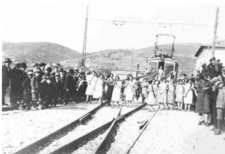
Inaugurazione della linea presso la stazione di Norcia 01-11-1926