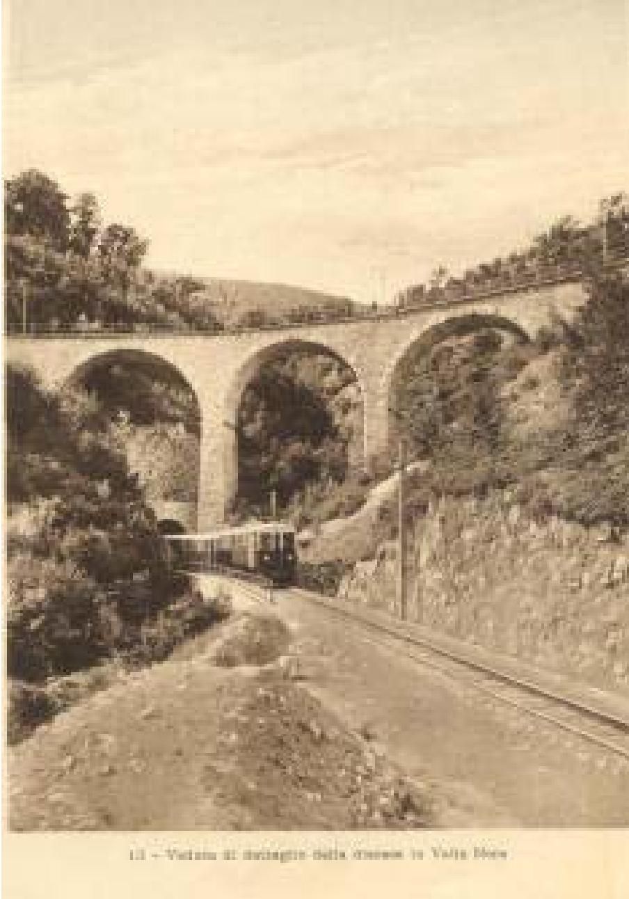
11 - Vista di un tratto della galleria in Valle Bova