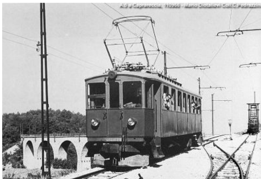
Motrice presso la stazione di Caprareccia (sullo sfondo il viadotto omonimo)

Per ulteriori informazioni e per effettuare prenotazioni potete rivolgervi presso la sede del CAI ogni mercoledì e venerdì dalle ore 19 alle 20, telefonare allo stesso orario allo 0736 45158 oppure consultare il ns. sito www.slowbikeap.it