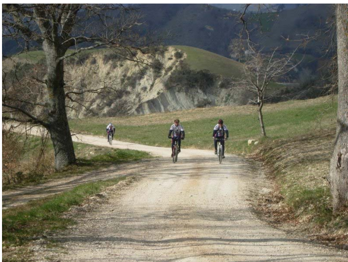
3 dopo Montadamo verso Castel di Croce

Per ulteriori informazioni e per effettuare prenotazioni potete rivolgervi presso la sede del CAI ogni mercoledì e venerdì dalle ore 19 alle 20, telefonare allo stesso orario allo 0736 45158 oppure consultare il ns. sito www.slowbikeap.it