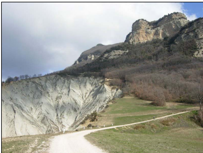
2 sullo sfondo il M. Ascensione