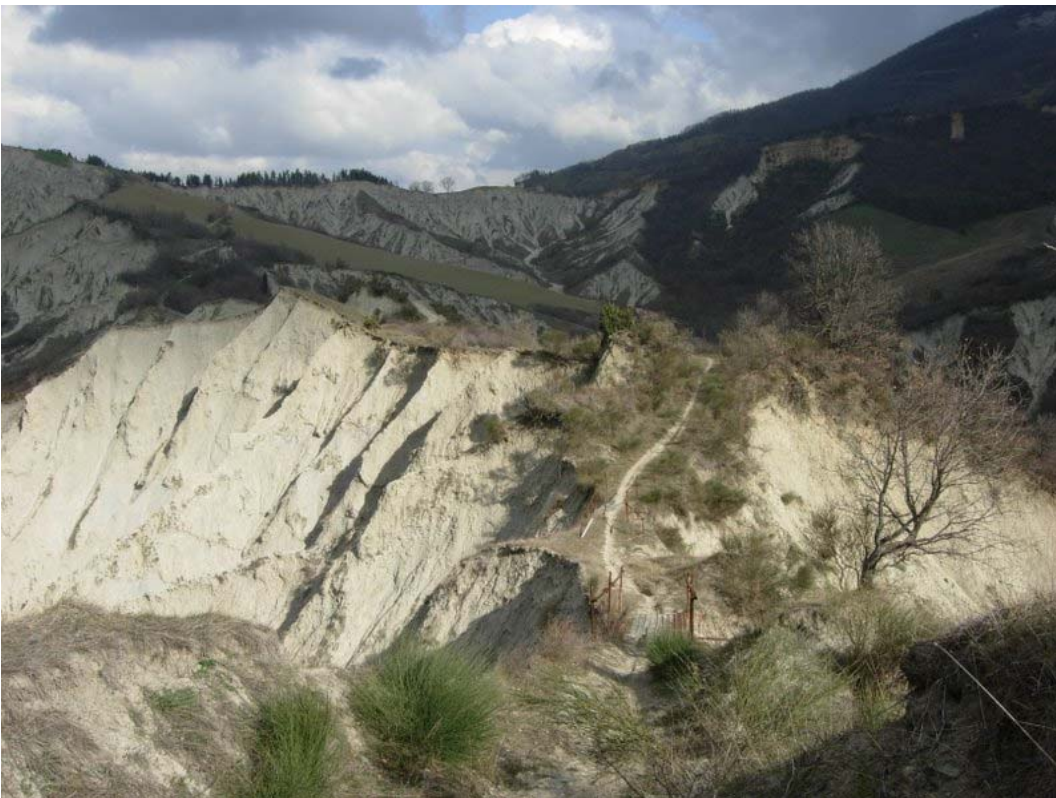
7 - un chiaro-scuro sui calanchi

Per ulteriori informazioni e per effettuare prenotazioni potete rivolgervi presso la sede del CAI ogni mercoledì e venerdì dalle ore 19 alle 20, telefonare allo stesso orario allo 0736 45158 oppure consultare il ns. sito www.slowbikeap.it