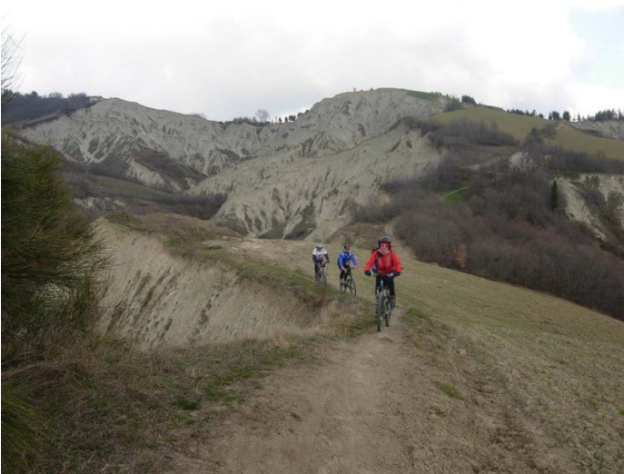
5 - un tratto del percorso sui calanchi

Per ulteriori informazioni e per effettuare prenotazioni potete rivolgervi presso la sede del CAI ogni mercoledì e venerdì dalle ore 19 alle 20, telefonare allo stesso orario allo 0736 45158 oppure consultare il ns. sito www.slowbikeap.it