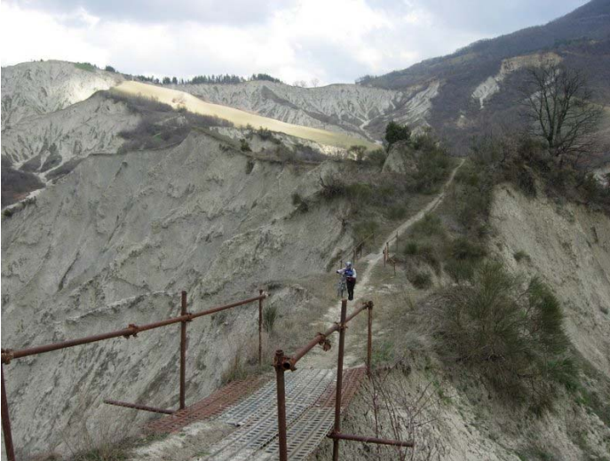
6 - il ponticello pericolante