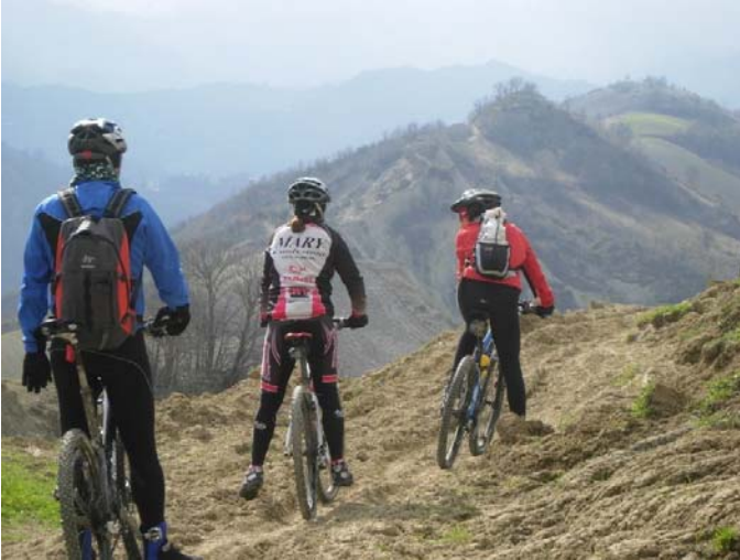
4 - l'inizio del crinale in discesa