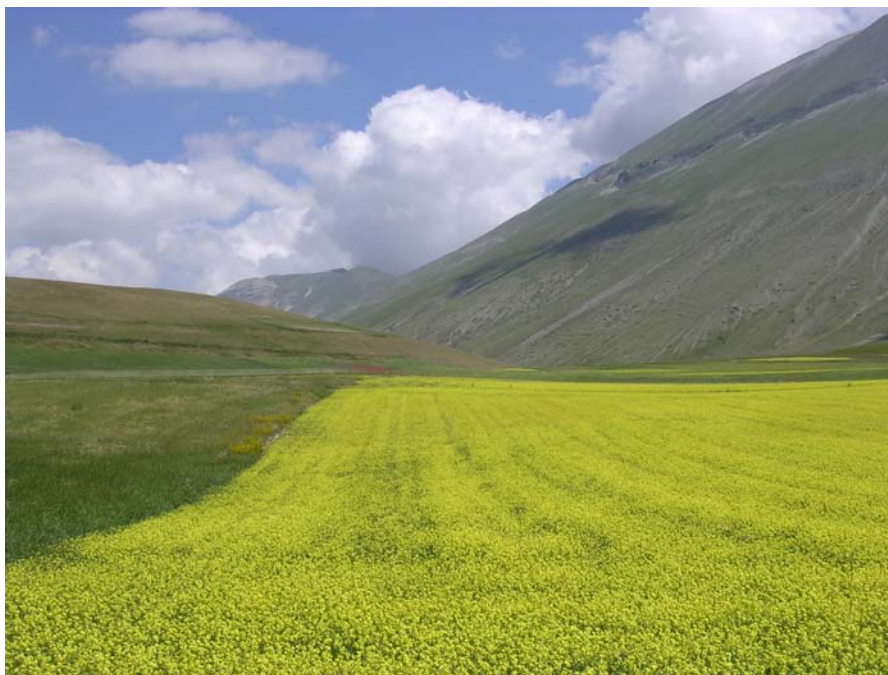
Pian Piccolo e le pendici del M. Vettore