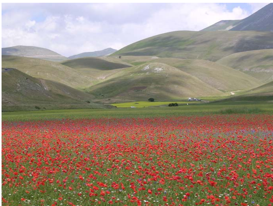
Verso Pian Perduto e Forca di Gualdo

Per ulteriori informazioni e per effettuare prenotazioni potete rivolgervi presso la sede del CAI ogni mercoledì e venerdì dalle ore 19 alle 20, telefonare allo stesso orario allo 0736 45158 oppure consultare il ns. sito www.slowbikeap.it