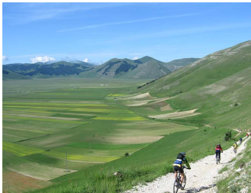
vista su Pian Grande

Per ulteriori informazioni e per effettuare prenotazioni potete rivolgervi presso la sede del CAI ogni mercoledì e venerdì dalle ore 19 alle 20, telefonare allo stesso orario allo 0736 45158 oppure consultare il ns. sito www.slowbikeap.it