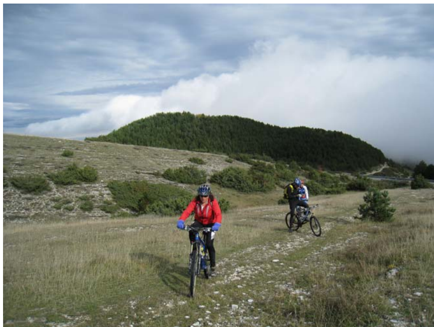
in salita nei pressi di S. Giacomo