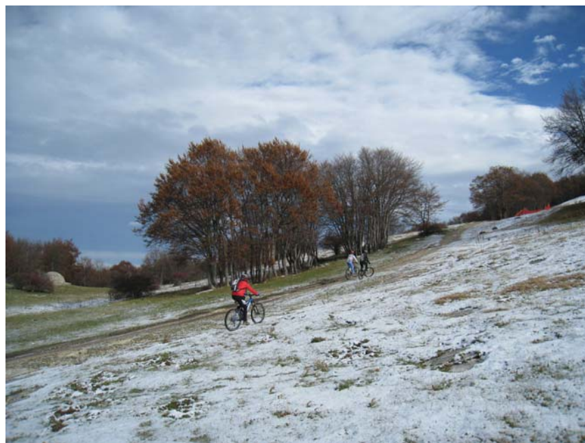
Prime nevi alle Tre Caciare

Per ulteriori informazioni e per effettuare prenotazioni potete rivolgervi presso la sede del CAI ogni mercoledì e venerdì dalle ore 19 alle 20, telefonare allo stesso orario allo 0736 45158 oppure consultare il ns. sito www.slowbikeap.it