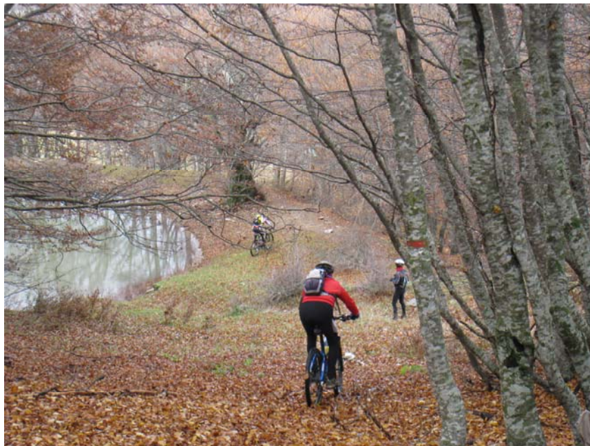
Il laghetto del Tritone