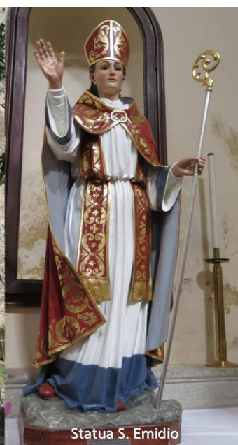
Statua S. Emidio