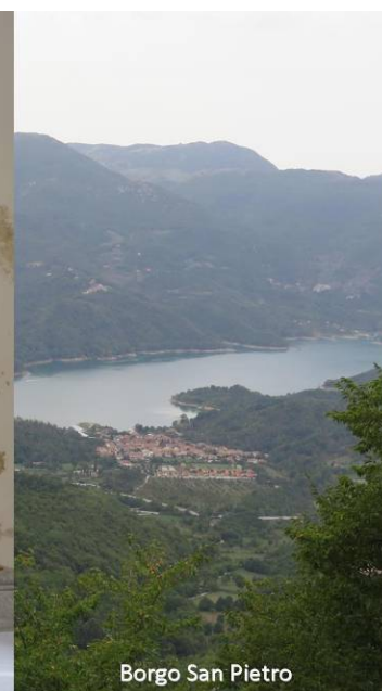
Borgo San Pietro

Per ulteriori informazioni potete rivolgervi alla sede CAI ogni mercoledì e venerdì dalle ore 19 alle 20, telefonare allo stesso orario allo 0736 45158 oppure consultare il ns. sito www.slowbikeap.it