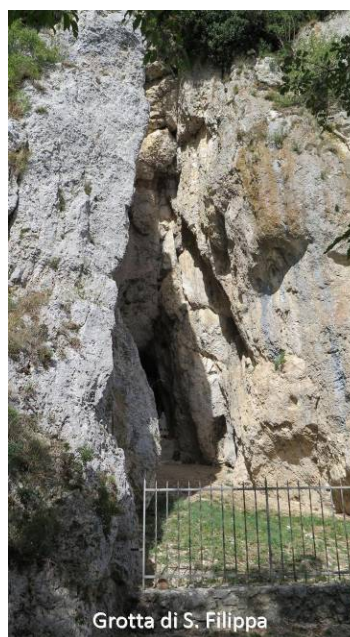
Grotta di S. Filippa