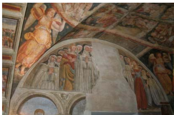
Cappella di S. Filippa Mareri

Prima Santa del Secondo Ordine Francescano, Filippa della nobile famiglia dei baroni Mareri nacque sul finire del sec. XII nel castello sopra S. Pietro de Molito, oggi Borgo S. Pietro. A seguito del passaggio di S. Francesco, avvenuto negli anni 1221-25, Filippa entrò nel nuovo ordine abbandonando gli agi della casa, come era avvenuto qualche anno prima a Chiara di Assisi. Rifugiatisi insieme ad