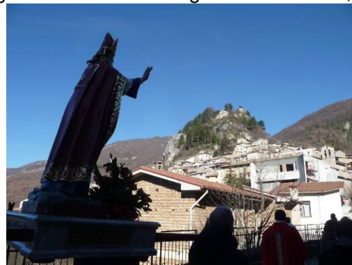
Processione di S. Emidio a Petrella Salto