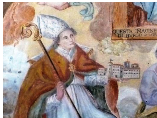
S. Emidio a Borgo San Pietro

Il disastroso terremoto del 13 gennaio 1915, quello che distrusse Avezzano, provocò morte e rovina anche nei paesi del Cicolano e solo Petrella Salto ebbe lievi danni così da eleggere a compatrono S. Emidio che viene festeggiato la domenica più vicina a quella data. Nella chiesa parrocchiale di S. Andrea è conservata la statua processionale, mentre un'altra sua immagine è affrescata nell'abside della piccola chiesa di S. Maria delle Grazie a Borgo S. Pietro che non fu sommersa dalle acque del nuovo lago artificiale.