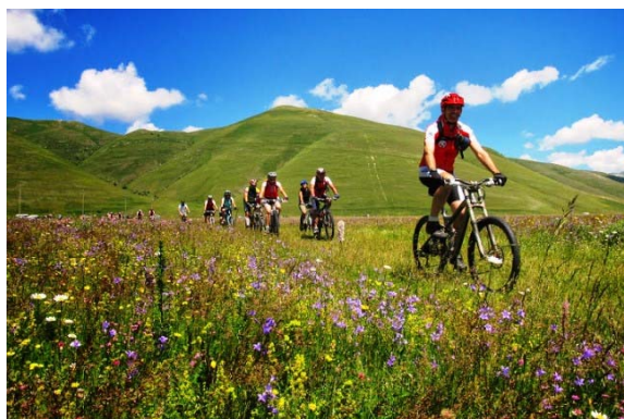
Immersi nella fioritura di Pian Grande