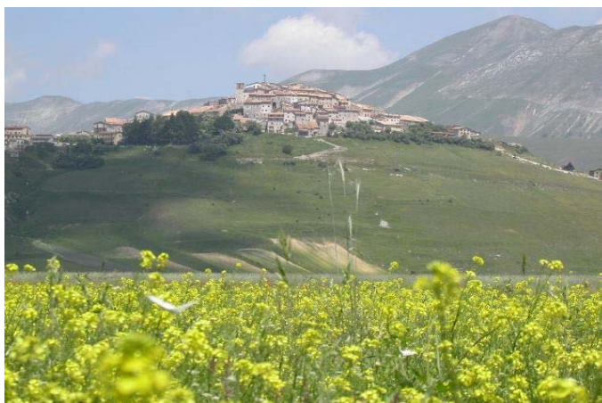
Castelluccio nel periodo della fioritura