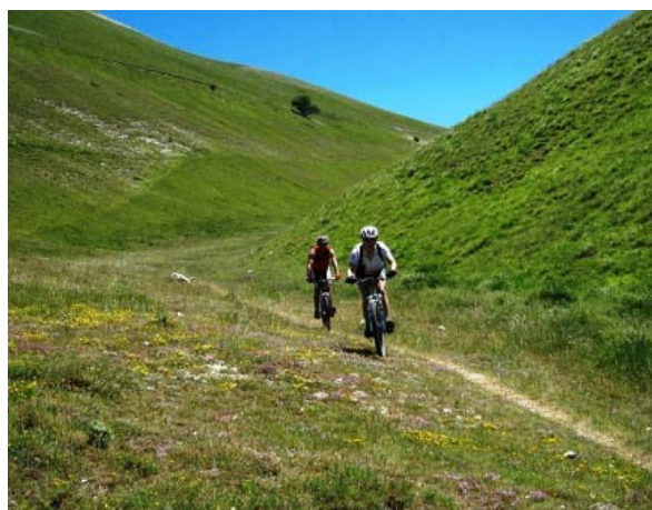
Dal rifugio degli Alpini si scende verso Pian Piccolo