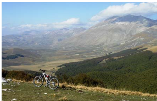
I Piani e il Vettore visti da Colle Cardisciana