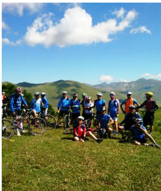
Foto di gruppo alla Fioritura del 2015